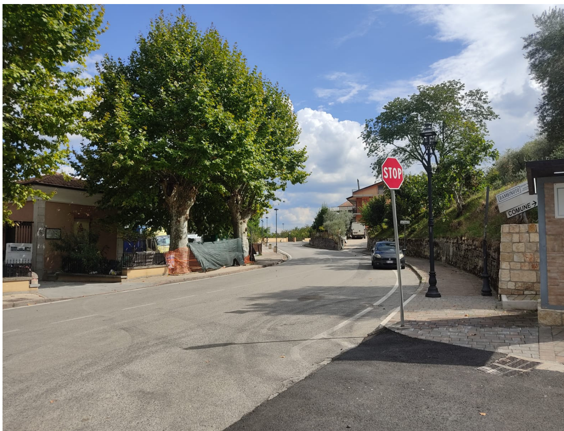
Foto 6 -Foto del contesto