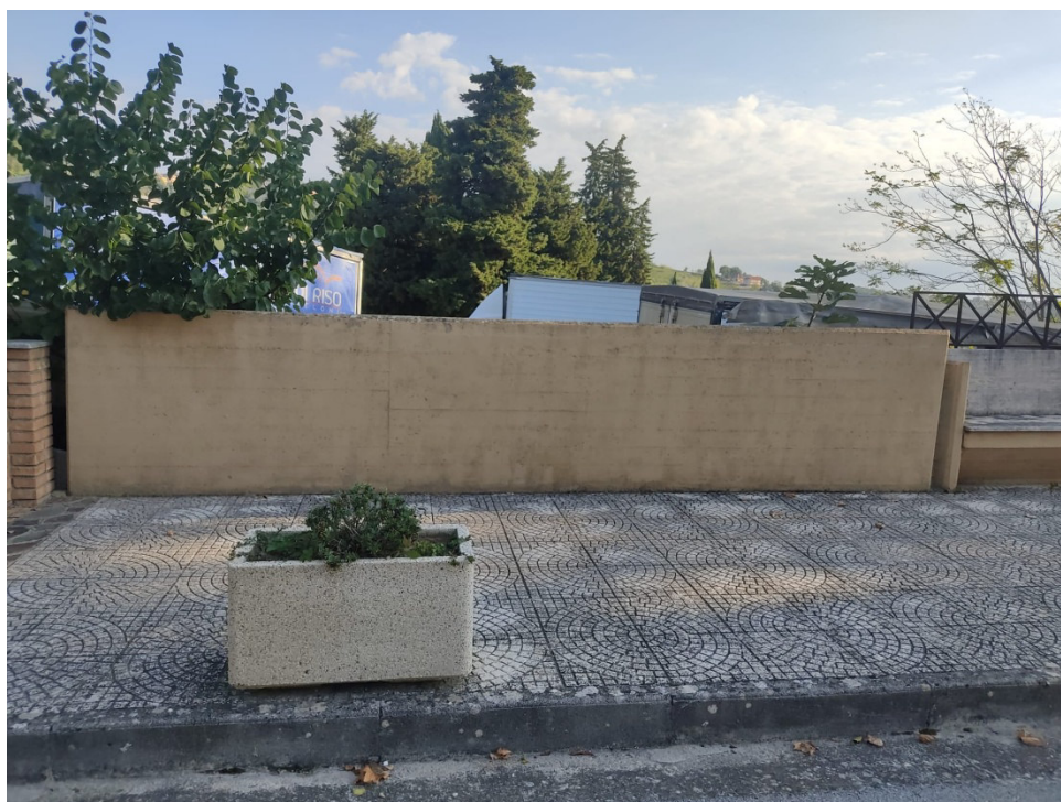
Foto 2 -Vista frontale