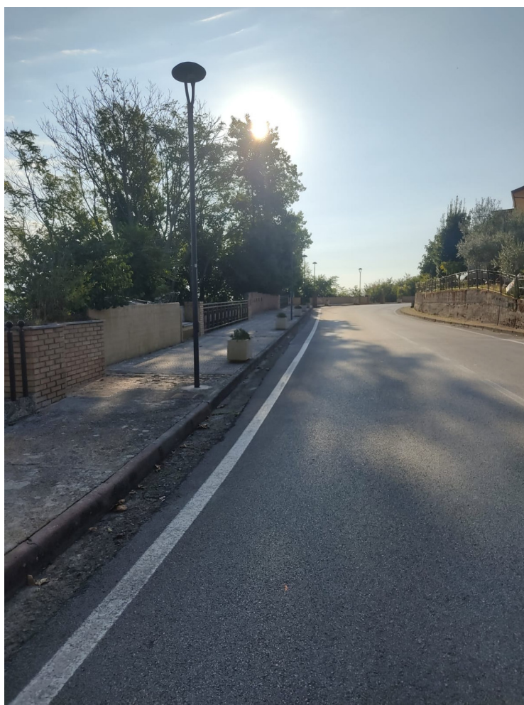
Foto 4 -Vista di scorcio